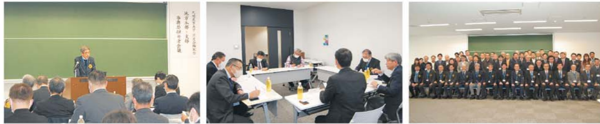
事務局会議(全体の様子)

各専門委員会の委員長等より、①楠風会創立60周年記念行事に向けての今後の予定について、②意見交換会において質問があった書面議決等について、③ホームページにおける地方本部・支部の活動予定・報告寄稿マニュアルについて、等の報告の後、8班に分かれて、主な議題「各現場での取り組みについて(事案)」に係る活発な意見交換が、茶話会も交え開催され無事終了いたしました。