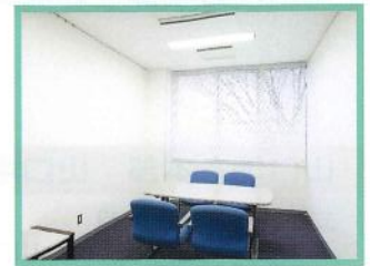
カウンセリングルーム 個別相談等を行います