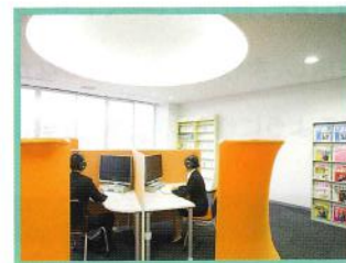
ビデオライブラリー 企業紹介等が閲覧できます