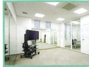
マナートレーニングルーム AV機器を活用した実習ができる鏡張りのマナートレーニングルーム

芝生広場を前面に、ホワイトカラーのおしゃれな装いの建物。正面にメイン入口。右のレンガ色の建物は図書館。