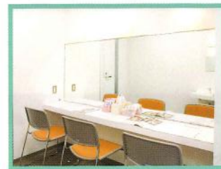
メイクコーナー 女子学生の悩みであるメイクを指導します