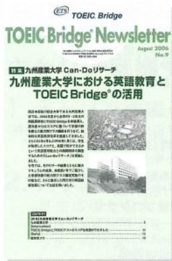
TOEIC Bridge Newsletter August 2006 No.9 抜粋。

本学と国際ビジネスコミュニケーション協会の共同研究「Can-Doリサーチ」の結果分析による「英語のできること」の一覧表は大きな社会的反響を呼んだ。