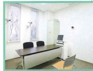
面接室 最新のAV機器を設置しています