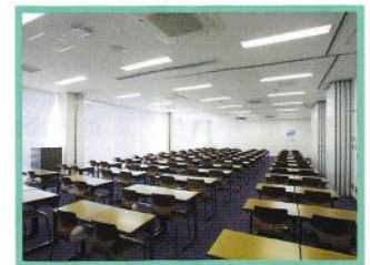
セミナールーム 企業説明会、就職ガイダンス等に利用する多目的のルーム