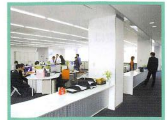
事務室 オープン構成にしています