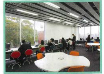
パソコンコーナー 就職活動に必要なパソコン40台を設置