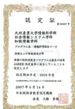
情報科学部JABEE認定証

平成18年度卒業生から、「情報科学総合コース」の修了生は、JABEEが認定した技術者教育プログラムの修了生として公式に認められることになり、海外でも一定の水準の教育を受けた技術者として認められることとなります。また、「情報科学総合コース」の修了は技術士(情報工学部門)の第一次試験の合格と同等であるとみなされ、技術士第一次試験が免除されます。