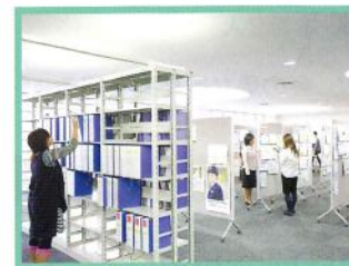
資料コーナー 求人票等を掲示しています