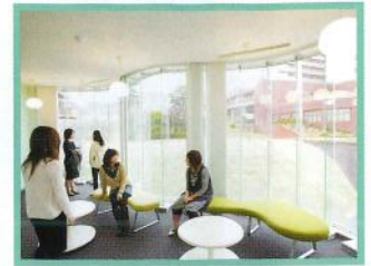
カウンター 資料等が閲覧できます