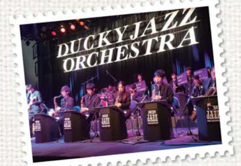
ダッキージャズオーケストラ