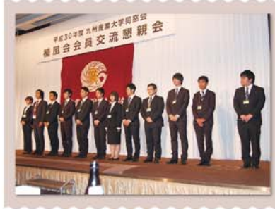
学生県人会紹介の様子