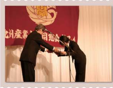
功労賞表彰の様子