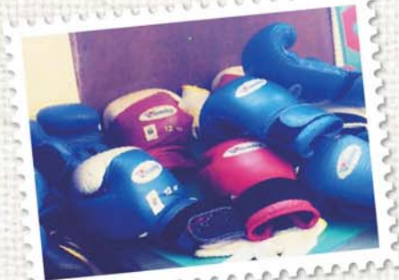
ボクシング部 (イメージ)