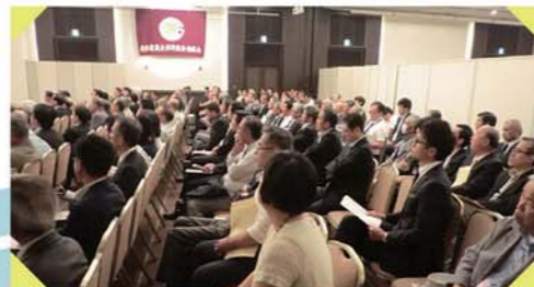
The day's picture in SOLARIA