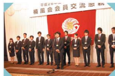
県人会学生代表挨拶