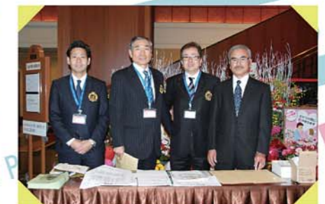
The day's picture in HAKATAZA