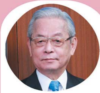
学校法人中村産業学園