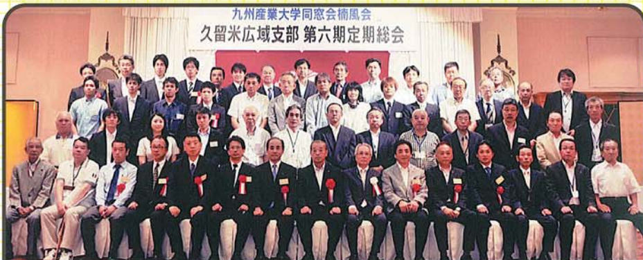
九州産業大学同窓会楠風会 久留米広域支部 第六期定期総会

この秋にイベント開催の予定があるため、年内に改めて報告致します。支部活動状況として、このイベントを会報にて宣伝いたしたく存じます。