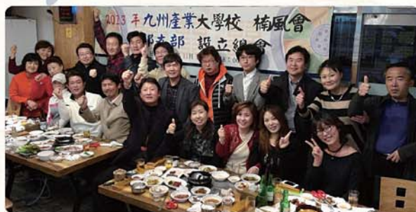
【総会・懇親会】平成25年11月16日(土)18:00~ 場所:テア韓牛焼き 釜山市東区凡一洞657の2番地 《会員数21人/本部1人》

支部長 金 大聖 連絡先 趙 東來(チョ ドンレ) 携帯 001-010-82-10-2056-2577