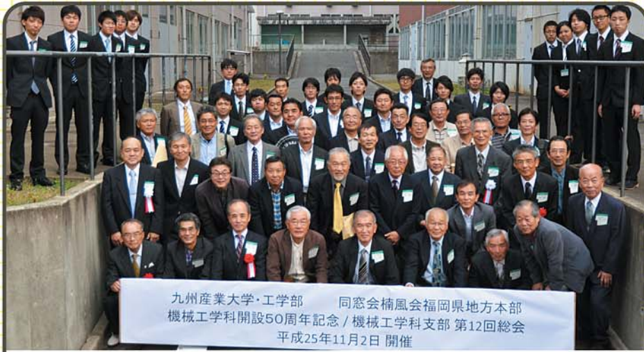
九州産業大学・工学部 同窓会楠風会福岡県地方本部 機械工学科開設50周年記念/機械工学科支部 第12回総会 平成25年11月2日 開催