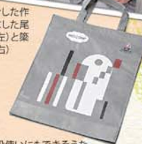
普段使いにもできそうなおしゃれなデザイン