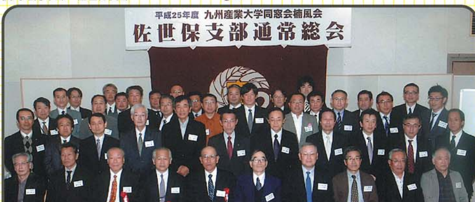
平成25年度 九州産業大学同窓会楠風会 佐世保支部通常総会

25年度総会は、新卒の参加者2名、マジックショー、景品抽選会と大盛況でした。佐世保支部は先輩達がみなさん優しい方ばかりで、若い人も安心して参加しています。九州産業大学卒業生で総会案内が届いていない方は、事務局にご連絡してください。