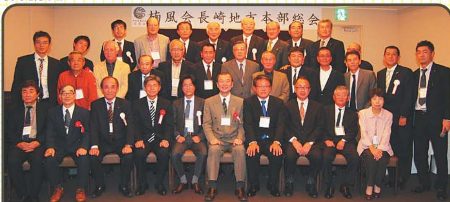
楠風会長崎地方本部総会

皆様のお力添えで、長崎も軌道に乗ったという感じがします。更に多くの人に来て欲しいです。同じ大学で学び、遊んだ仲間ですので、お一人でも、友達同士でも気軽に参加してください。楽しい交流の場になっていますよ。