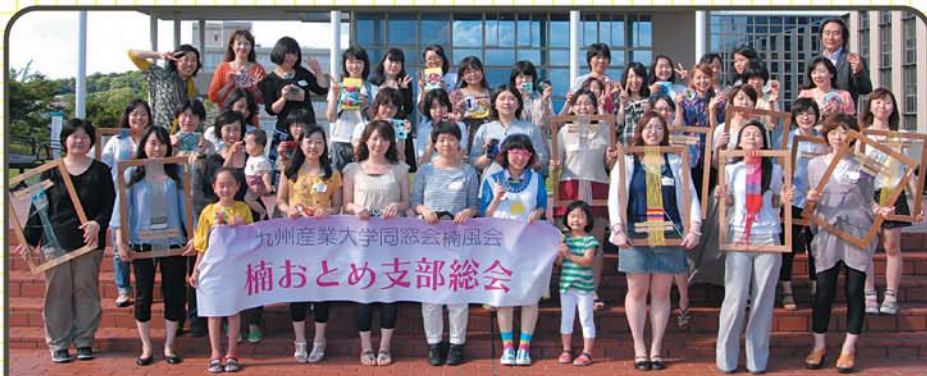
九州産業大学同窓会楠風会 楠おとめ支部総会

大好評「手芸カフェDEおしゃべり」の第三弾!手芸カフェ☆X'mas Ver. 手芸しながらお菓子とテーブルをかこむと、不思議となごんでしまいます。人見知りさんも、お子様連れの方も大歓迎!クリスマスリースを作りながら、ちょっと早いX'maspartyをしましょう☆ 詳しくはFACE BOOK!楠おとめを検索!新規会員、随時募集中。