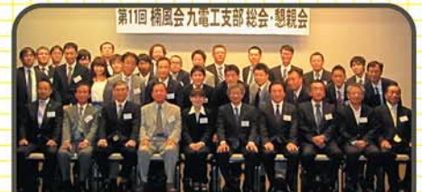
第11回 楠風会九電工支部 総会・懇親会

会社内に卒業生が131名となりました。身近に先輩や後輩がいることが分かり、交流が図れています。今後は福岡県以外の会員の方々にも楠風会を浸透させ、活動を活発にしていきたいです。