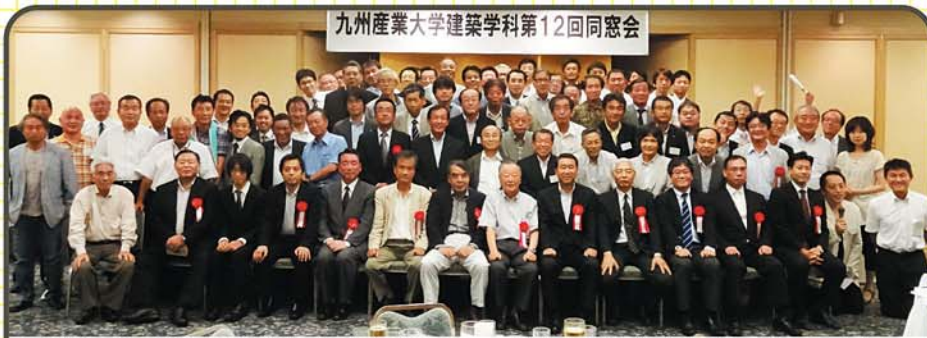
九州産業大学建築学科第12回同窓会

建築学科の同窓会として、建築学科主宰の卒業研究合評会への参加など卒業生と在学生の交流を行っています。