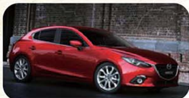
アクセラスポーツ/MAZDA3

学生時代の学習、経験、遊びなどの全てが現在のベースとなって、そのころと変わらないデザインへの思いを持ち続けることで、ここまでくることができたと言っています。