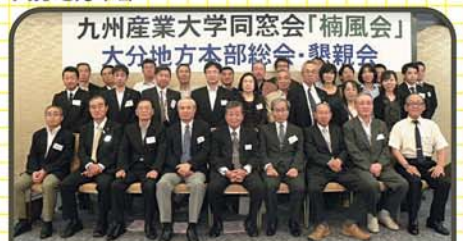
九州産業大学同窓会「楠風会」 大分地方本部総会・懇親会

会員増加のために楽しい懇親会になるように企画いたします。たくさんの方の参加をお待ちしております。