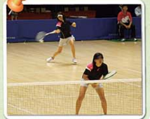
準決勝の早稲田大学との試合で大奮闘

5月27日現在、平成25年度九州学生ランキング(女子ダブルス)ではトップ5のうち、九産大が3ペアを占めています。