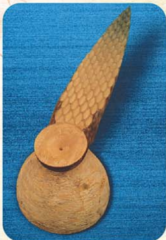
「ドコカラキテドコヘイノカ 2013」 W600×D2100×H700