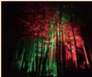
さくたのうなでのライトアップ