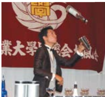
会員交流懇親会でのアトラクション