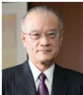
九州産業大学 学長 山本 盤男