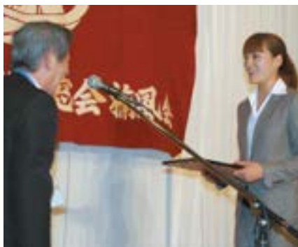
楠風会功労賞の表彰式