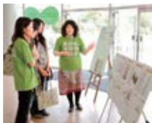
学生の開発秘話に聞き入る参加者たち。