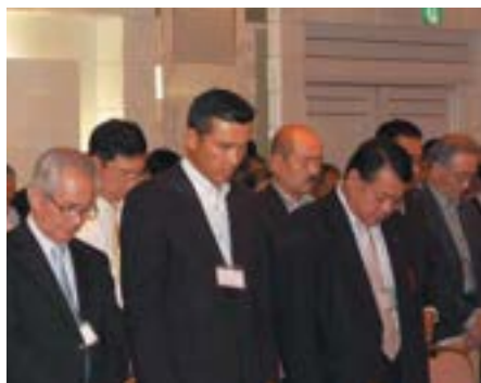
東日本大震災で犠牲になった方々へ、出席者全員で黙祷