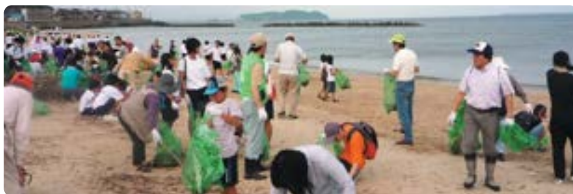
山口地方本部 綾羅木海岸清掃ボランティア参加