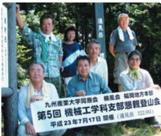
機械工学科支部親睦登山会