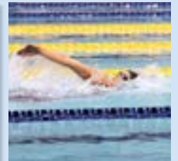
女子100m背泳ぎと200m背泳ぎで優勝。2種目とも自身が持つ大会記録を更新する泳ぎで、3年連続の2冠に輝きました。