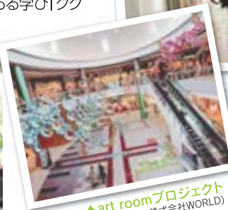
▲art roomプロジェクト (芸術学部×株式会社WORLD)