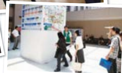
当日会場は熱気に包まれました。