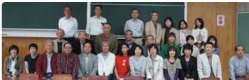
広島市役所支部、香椎祭バスツアー