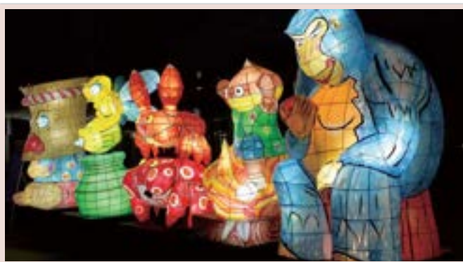
子供達に喜んでもらう為、「さるかに合戦」のねぶた劇を開催しました。