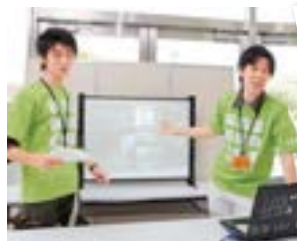
参加者と楽しくコミュニケーションが図れました。