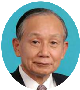
学校法人中村産業学園 理事長