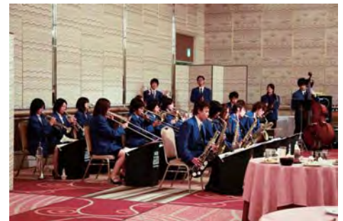
友情出演のダッキージャズオーケストラ