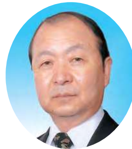
九州産業大学 学長