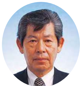
同窓会楠風会 会長