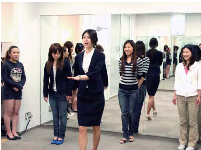
プロの現役モデルが講師を務める「ブラッシュアップ講座」