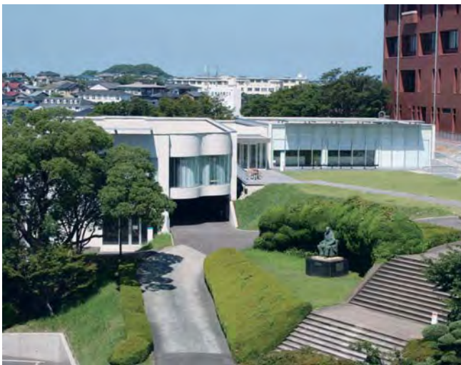
キャリア支援センター外観

主に国の検疫所と地方自治体の保健所に所属し、食品の検査や食中毒の調査、食品製造業や飲食店の衛生監視、指導および教育を行います。