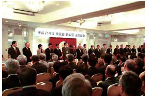
総会風景(新役員紹介)