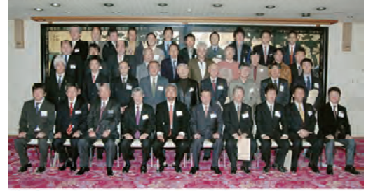
九州産業大学同窓会楠風会 熊本城北支部設立総会 2009.3.14 富士ホテル