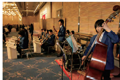
友情出演のダッキージャズオーケストラ